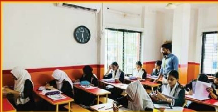
● নিয়মিত Class Test, Surprise Test, মাসিক, টিউটোরিয়াল ও পার্বিক পরীক্ষা গ্রহণ।