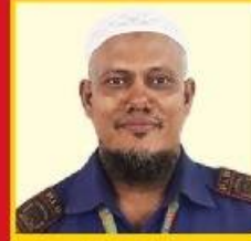
Jewel Akon Security Guard