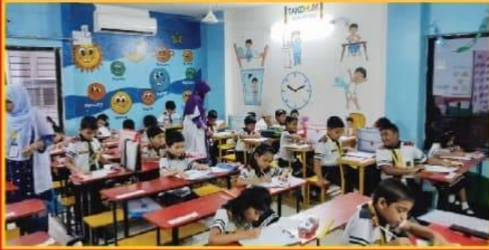
● অভিনব আরামদায়ক ও আধুনিক সাজে সু-সজ্জিত শ্রেণিকক্ষ।