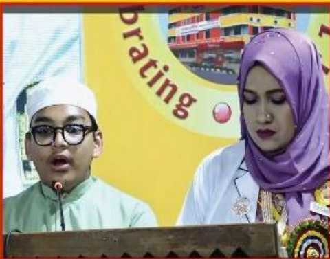
বার্ষিক ক্রীড়া প্রতিযোগিতার পুরস্কার বিতরণী অনুষ্ঠানে কোরআন থেকে তেলাওয়াত করছে অত্র বিদ্যালয়ের কৃতি ছাত্র।