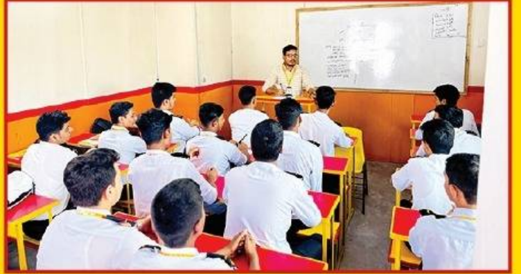
● ইংরেজি ও গণিত শিক্ষার উপর বিশেষ গুরুত্ব দেওয়া হয়।