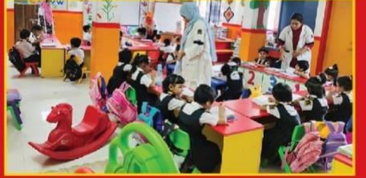
● চিন্তা ও ভীতি দূর করতে শিক্ষার্থীদের মানসিক সহায়তা প্রদান।