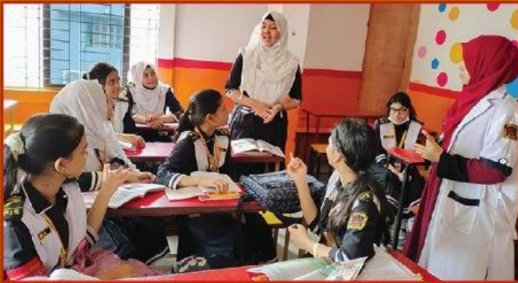
● পূর্ব পাঠের উপর গুরুত্ব আরোপ।