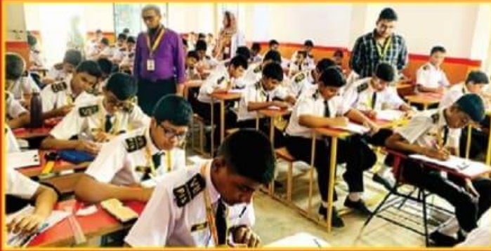
● পূর্ব পাঠের উপর নিয়মিত শ্রেণি পরীক্ষা গ্রহণ।