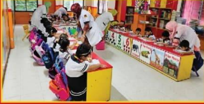
● শান্ত ও সহায়ক পরিবেশে পরীক্ষা গ্রহণ।

প্রতিটি সেমিস্টারের সময়সীমা ৬ মাস অর্থাৎ ৬ মাস অন্তর অন্তর ছাত্র/ছাত্রীদের বছরে (১২ মাসে) ২টি কোর্স ফাইল দেওয়া হয়। উক্ত ফাইলে একেকটি সেমিস্টার পরীক্ষার সিলেবাস সহ প্রতিটি বিষয়ের উপর কোর্সফাইল প্রদান করা হয়। এতে ছাত্র/ছাত্রীরা কোন কারণবশতঃ ফুলে অনুপস্থিত থাকলেও দূরে থেকে উক্ত সিলেবাস/কোর্স ফাইলের মাধ্যমে শ্রেণির কাজের সাথে জড়িত থাকতে পারবে।