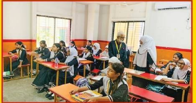
● সাধারণ জ্ঞানের উপর গুরুত্ব আরোপ।

ব্রাস চলাকালীন সময়ে প্রভাতী ও দিবা শাখার শিক্ষার্থীদের একাংশ।