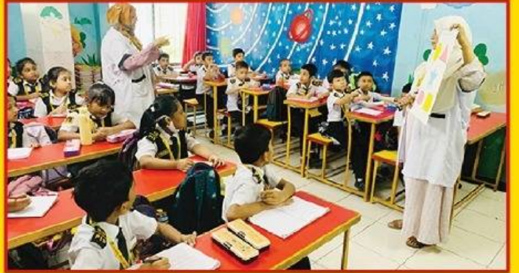
● শিক্ষা উপকরণের সাহায্যে পাঠ উপস্থাপন।