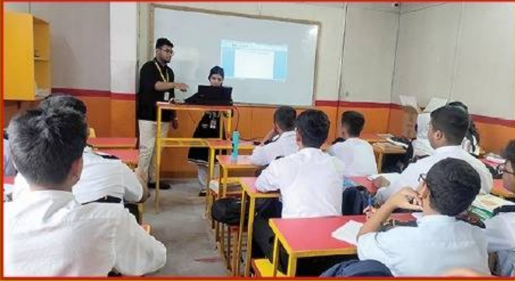
● প্রজেক্টরের মাধ্যমে পাঠদান করা হয়।