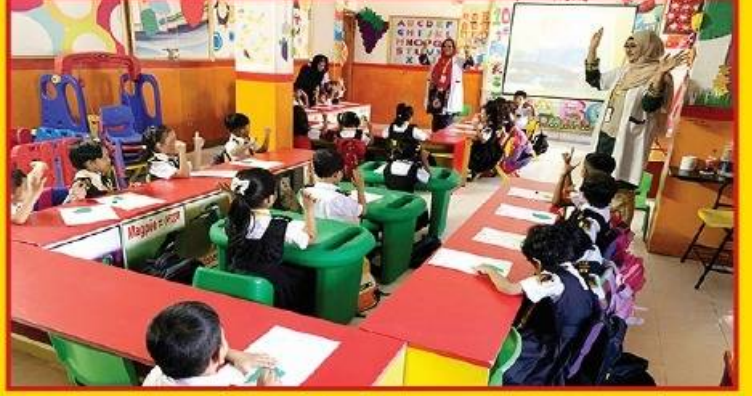
● অধিকাংশ পাঠ শ্রেণিতেই সম্পন্ন করা হয়।