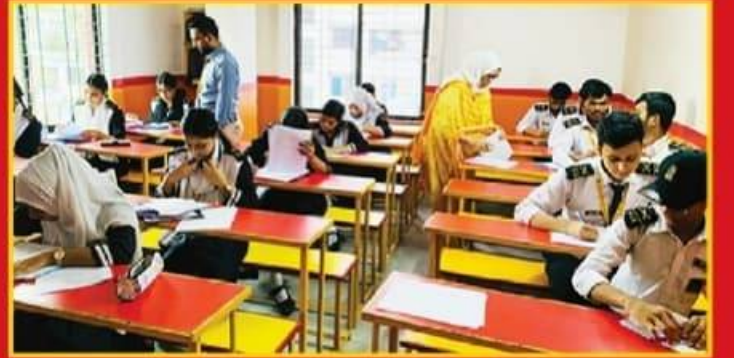
● স্বাস্থ্যকর পরিবেশ ও আধুনিক শ্রেণিকক্ষ।