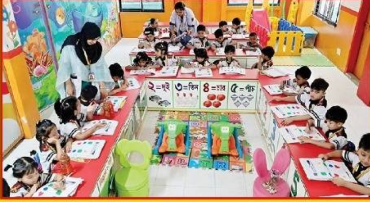
● শ্রেণি পাঠের উপর বিশেষ গুরুত্ব আরোপ।