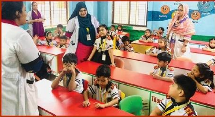
● কোলাহল মুক্ত নিরিবিধি ও মনোরম পরিবেশে মাতৃভাষে পাঠদান।