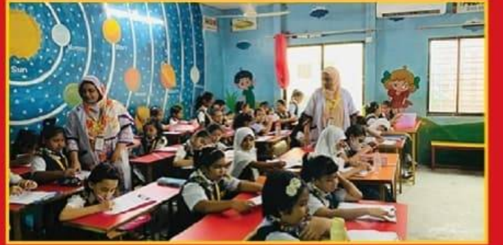
● সুবিশাল ও পরিপাটি শ্রেণিকক্ষে পাঠদান।