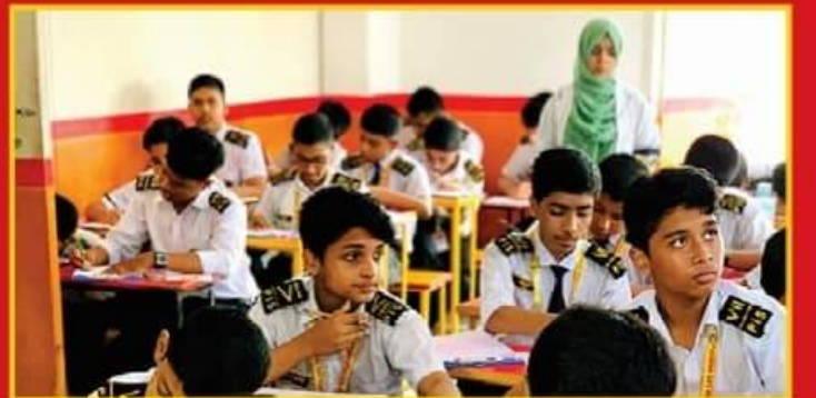
● শব্দ দূষণ মুক্ত সুপ্রশস্ত পরিষ্কার পরিচ্ছন্ন শ্রেণিকক্ষ।

পরীক্ষা চলাকালীন সময়ে প্রভাতী ও দিবা শাখার ছাত্র/ছাত্রীদের একাংশ।