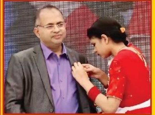
● বার্ষিক ক্রীড়া প্রতিযোগিতার পুরস্কার বিতরণী অনুষ্ঠানে প্রধান অতিথি ও উপদেষ্টা মণ্ডলীদের ফুল দিয়ে বরণ করছে অত্র বিদ্যালয়ের শিক্ষার্থীবৃন্দ।