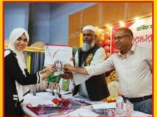
বার্ষিক ফলাফল ও ক্রীড়া প্রতিযোগিতার পুরস্কার বিতরণী অনুষ্ঠানে পুরস্কার গ্রহণ করছে অত্র বিদ্যালয়ের কৃতি শিক্ষার্থীবৃন্দ।